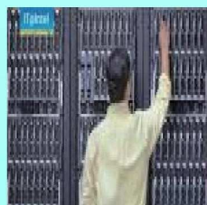
網際網路資料中心